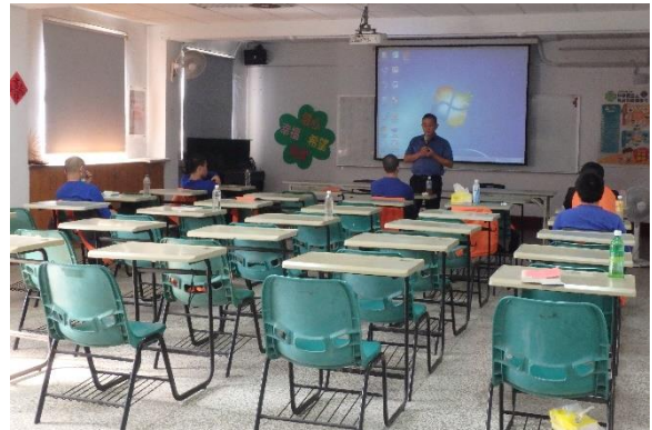
▲林先生戒毒歷程分享