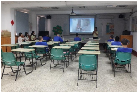
▲張先生戒毒歷程分享