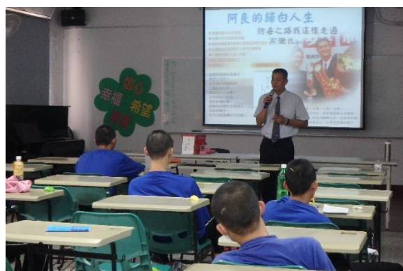
▲高先生戒毒歷程分享