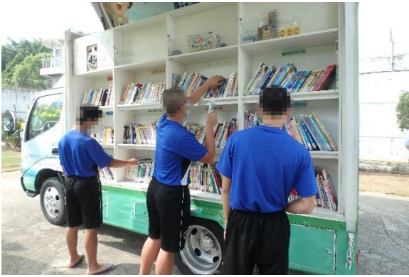
▲少年自書車挑選書籍

10月13日(星期二)、10月27日(星期二)9時至10時，佛光山南台別院「雲水書坊」行動書車進入戒護區，由少年依其興趣，借閱書籍，隨後志工帶領少年導讀，計有少年29人次參加。