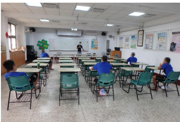
▲劉業務輔導員講授勞資雙方注意事項

10月13日(星期二)14時至14時30分邀請勞動部勞動力發展署雲嘉南分署合辦「科學實證之毒品犯處遇模式計畫」—職業輔導講座，由劉業務輔導員蒞所進行政令宣導以及講授勞資雙方注意事項，計有少年11人參加。