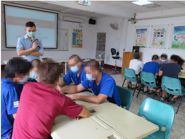
▲透過暖身活動催化少年與家長之互動

本所於10月30日(星期五)9時至11時30分舉辦收容少年家庭支持方案—「父母效能團體課程暨懇親會」活動，邀請蘇老師帶領，計有少年5人及家長7人參加。活動開始由蘇老師帶領少年與家長進行暖身活動及溝通體驗活動，引導少年及家長從互動中看見彼此的好，並藉著指揮與被指揮的體驗中學習换位思考；接續為懇親時間，少年及家長珍惜相處時光，並在家長的打氣中，為活動畫下句點。