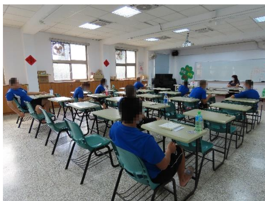
▲所長講授弟子規課程

10月7日(星期三)、10月21日(星期三)9時至10時所長為少年講授生命品格教育、中心德目、弟子規課程並辦理有獎徵答，計有少年26人次參加。