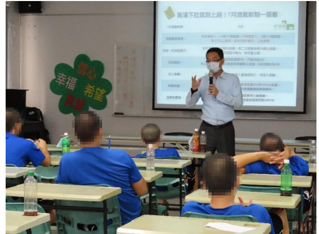
▲檢察官說明交通安全之司法處遇