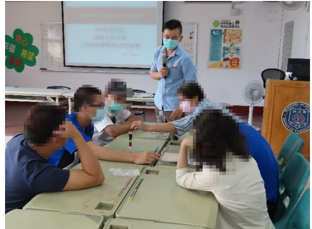
▲少年及家長透過活動進行體驗與學習