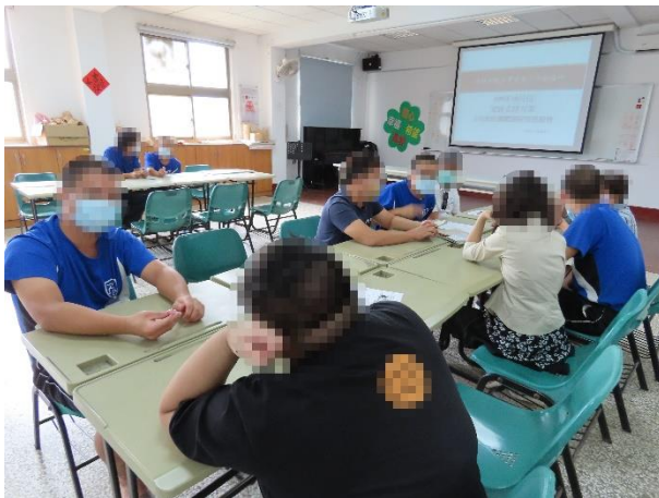
▲少年與家長相互表達思念