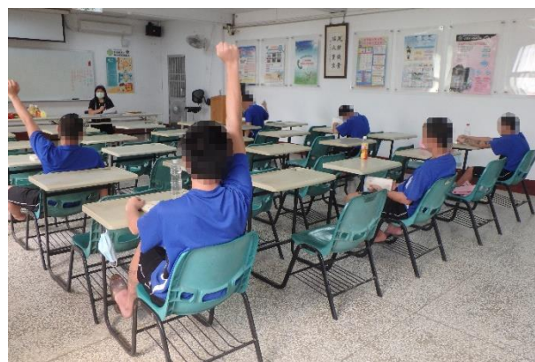
▲所長授課後有獎徵答