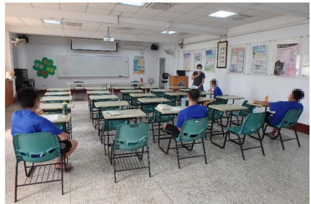
▲黃社工師說明毒品對於人體之危害