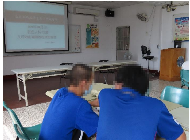
▲離別之際，爸爸的再三叮嚀