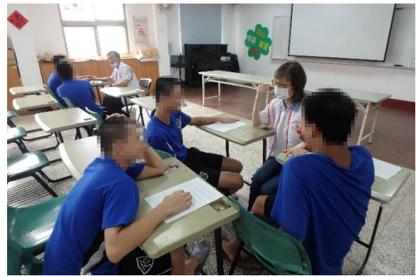
▲志工帶領導讀情形