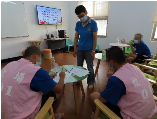
▲許老師邀請少年撰寫家庭價值觀學習單

10月16日(星期五)、10月30日(星期五)9時至11時辦理「科學實證之毒品犯處遇模式計畫」家庭支持方案—子職教育課程，由許老師講授，計有少年23人次參加。