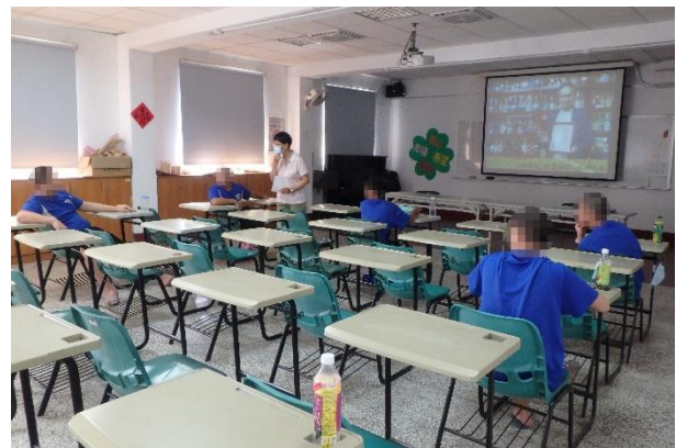
▲許老師邀請少年分享自身經驗