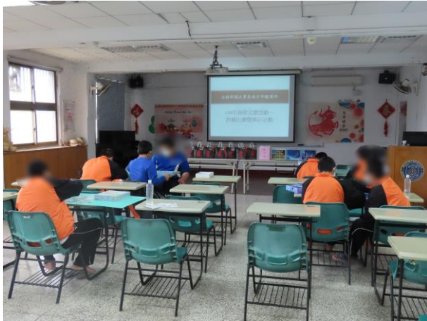
▲益智拼圖比賽情況

2月11日(星期四)9時至11時、2月14日(星期日)9時至11時分別舉辦春節開封日「益智拼圖比賽」暨「福氣摸彩」文康活動、「新春成語接力」暨「好運戳戳樂」文康活動等，計有少年21人次參加。