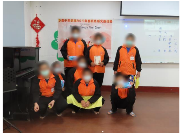
▲大年初三文康活動大合照