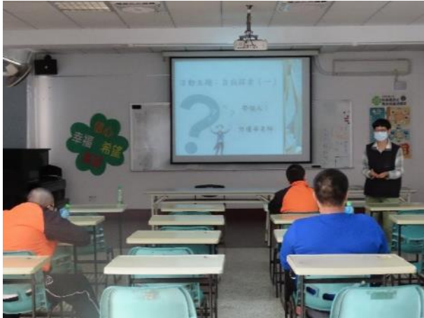
▲許老師講授自我探索課程

2月5日、2月19日(星期五)9時至11時辦理「科學實證之毒品犯處遇模式計畫」家庭支持方案—子職教育課程，由許老師講授自我探索課程，透過課程內容瞭解少年自身個性，發掘優點並改善缺點，計有少年23人次參加。