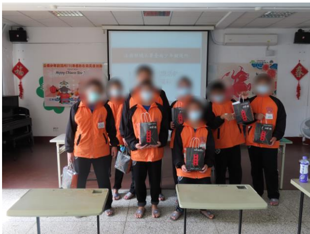
▲除夕春節文康活動大合照