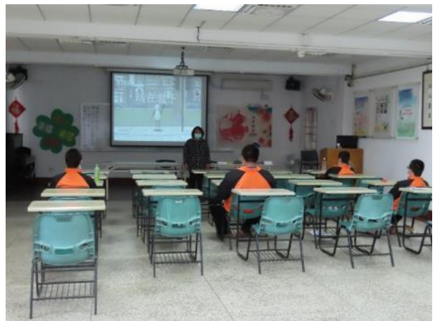
▲張老師引導少年練習專注力