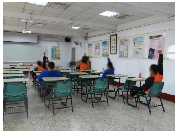
▲有獎徵答活動情形