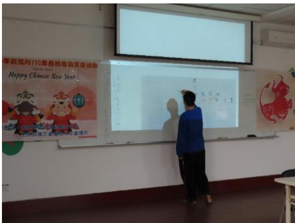
▲少年腦力激盪成語接力