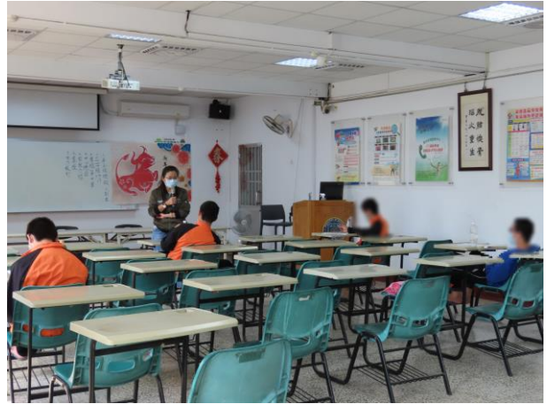
▲社工師帶領少年檢視生活情形