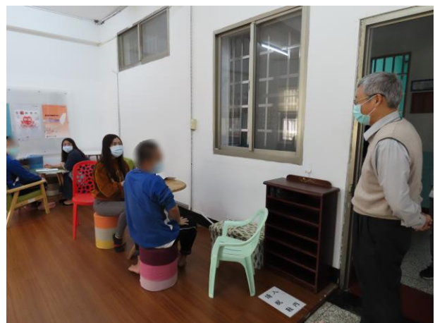
▲謝法官關懷少年上課情形