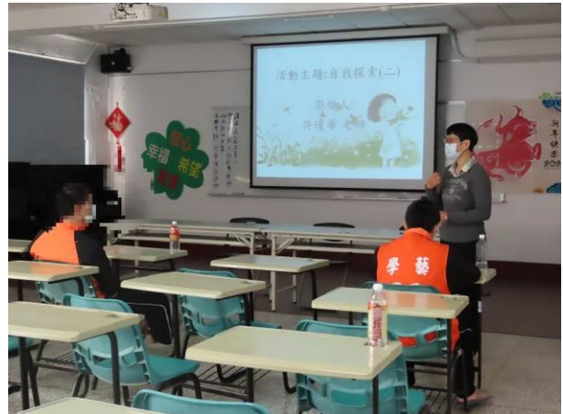
▲許老師帶領少年發掘自身優點