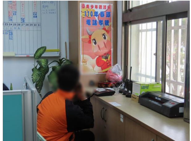
▲少年透過電話傳達對家人的感謝