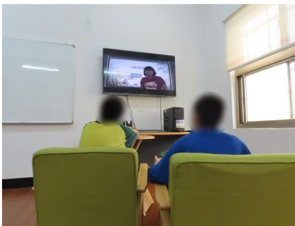
▲少年線上自主學習(國文)

6月17日(星期四)、6月21日(星期一)、6月22日(星期二)、9時至11時、6月23日(星期三)10時至11時、6月24日(星期四)09時30分至10時30分、6月28日(星期一)9時至10時、6月29日(星期二)9時至9時30分、10時30分至11時、6月30日(星期三)15時30分至9時，因應疫情嚴峻、停止外界講師入所授課，提供臺南市政府教育局線上教學影片自主學習，計有少年11人次參加。