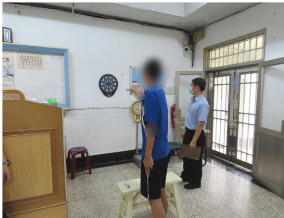
▲軟式電子飛鏢比賽

6月23日(星期三)9時至10時，舉辦文康活動—軟式電子飛鏢比賽，計有少年11人參加。