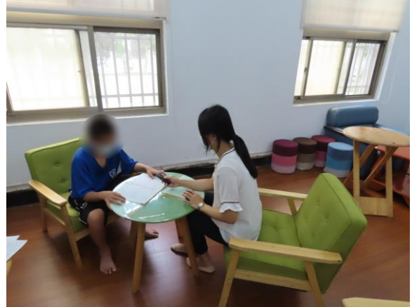
▲ 少年手寫對家人的感謝