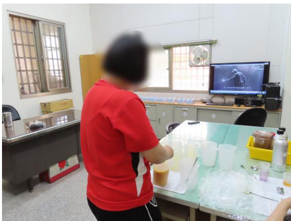
▲少年調製手工皂材料

6月7日(星期一)、6月8日(星期二)9時至11時，由本所女管理員教授製作手工皂課程，分別為檜木、香茅、紫草、水果四種手工皂，計有少年2人次參加。