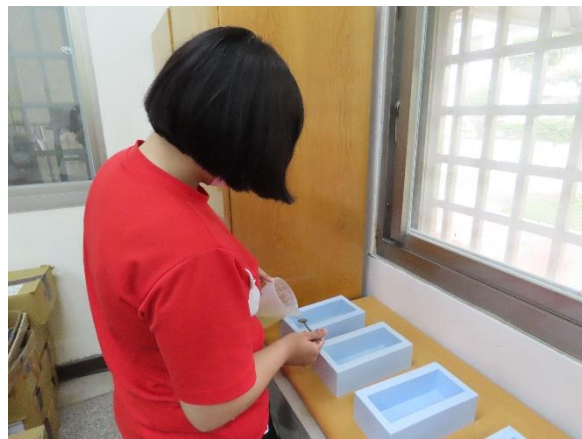
▲少年將材料倒入模具中