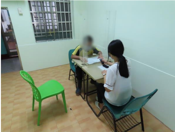
▲ 語音紀錄少年對家人的思念

6月17日(星期一)10時至10時30分，進行枕邊細語紀錄活動，藉由少年親手書寫文字稿，紀錄對家人的感謝與思念，並以錄音的方式向家人表達內容，讓少年與家人能維繫並增進親子關係，計有少年2人參加。