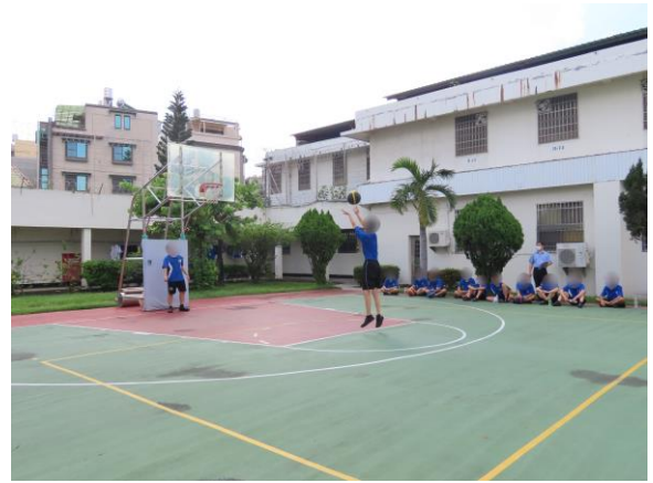
▲少年專注投入比賽中