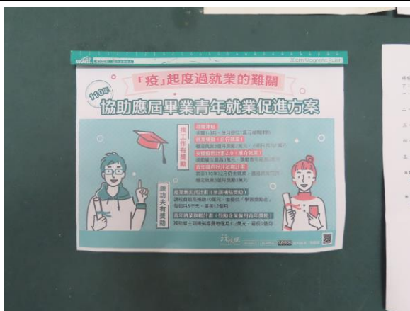
▲協助青年就業促進方案