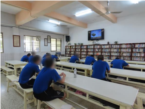
▲少年線上自主學習

本月份上午及下午時段，進行臺南市政府教育局線上教學影片自主學習課程，學習內容為七至九年級，自然、歷史、地理、公民、理化…等，讓少年於疫情期間能持續充實自我、加強國民教育學業，計有少年428人次參加。