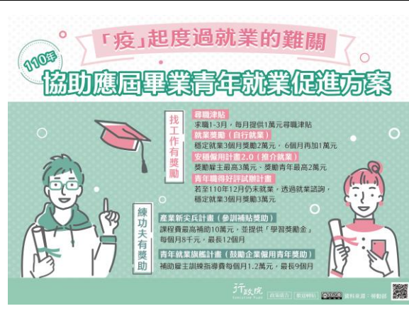
▲協助青年就業促進方案