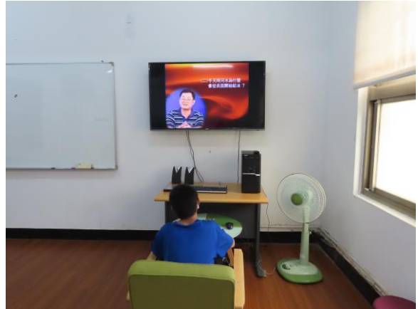
▲國中生少年自主學習