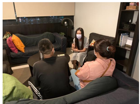
▲透過諮商輔導協助少年