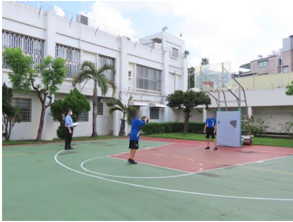
▲少年於罰球線定點投籃

8月19日(星期四)09時至10時，舉辦8月份生活文康活動「三分線及罰球線定點投籃」，比賽結果為第1名曾○○、第2名何○○、第3名陳○○，計有少年12人參賽。