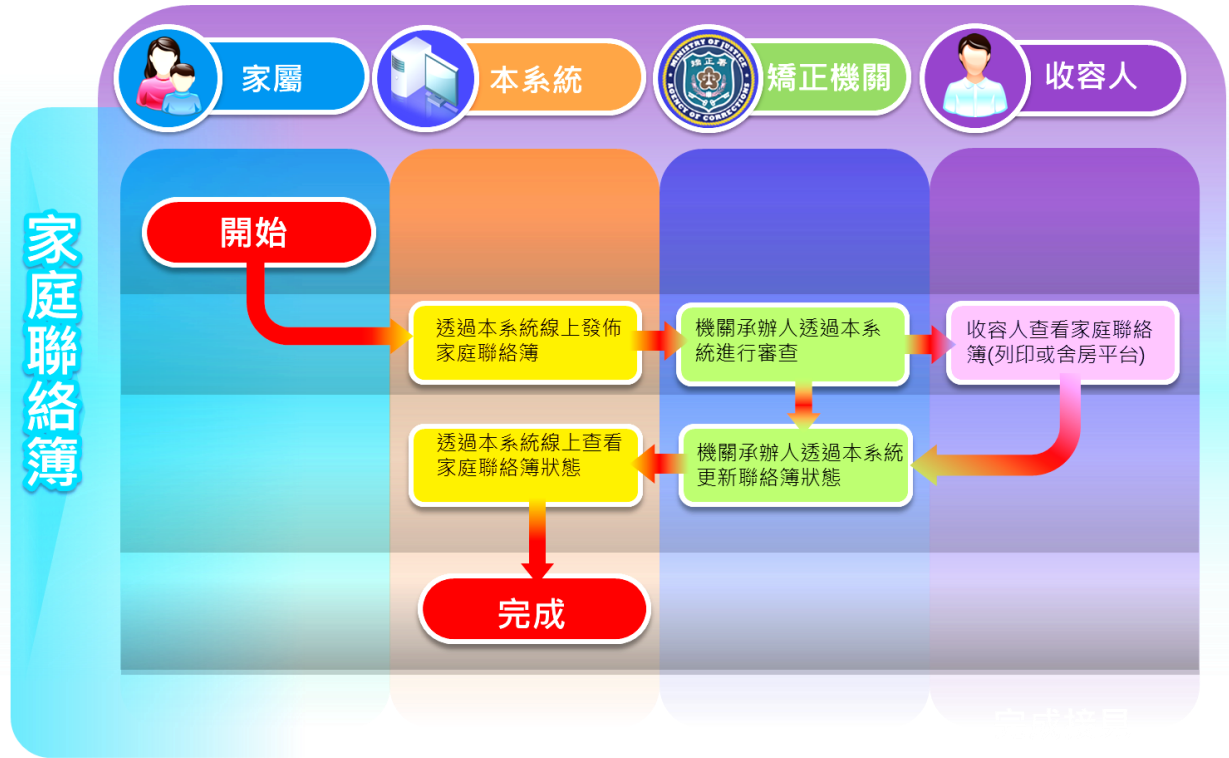
圖 1-1：電子家庭聯絡簿流程

電子「家庭聯絡簿」提供家屬與收容人溝通的平台，家屬可透過此功能發佈照片或留言，發佈的內容需經由機關承辦人審核後才交由收容人查閱。