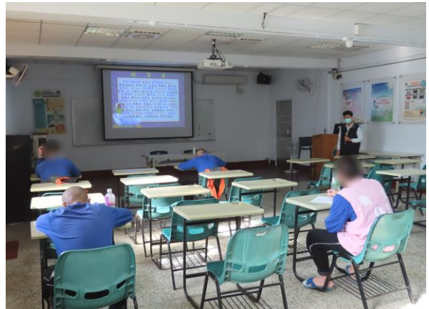
▲人格特質詳細解說