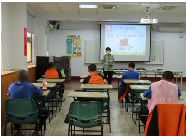
▲許老師講授家庭支持重要性

1月6日、7日、13日9時至11時，辦理「科學實證之毒品犯處遇模式計畫」家庭支持方案—子職教育課程，探討家庭支持力、人際及兩性關係相處、建立少年正確價值觀及改善人際互動模式，避免因溝通誤會而導致摩擦事件發生，計有少年42人次參加。