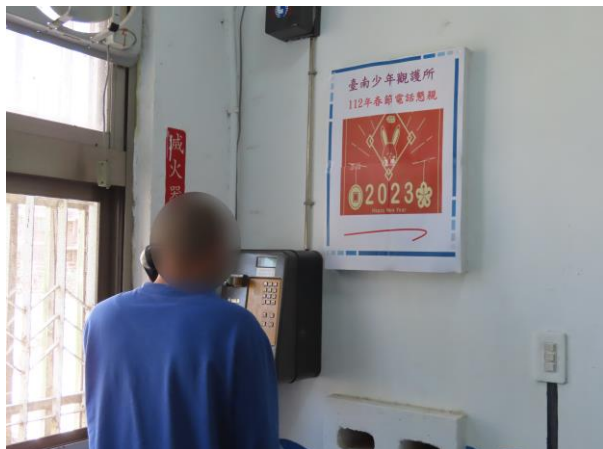
▲春節電話懇親活動

1月16日14時至16時，舉辦春節電話懇親，讓無法到場參加春節面對面懇親之少年，可透過電話方式聯繫家人，亦可傳達對家人的思念及佳節祝福，以彌補無法參加面對面懇親之遺憾，計有少年6人、家長6人參加。