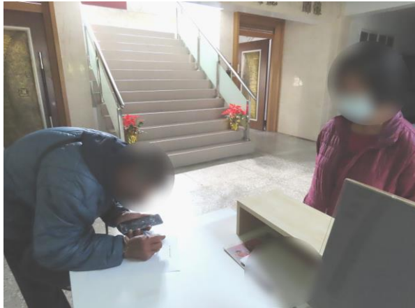
▲家長申請家庭聯絡簿

1月18日14時至15時，協助收容少年之家長進行電子家庭聯絡簿註冊帳號及登入資料上傳完畢，讓收容少年收到家長傳達之關心及近況訊息，增進少年與家長之親子關係，強化家庭支持力，計有少年1人、家長1人參加。