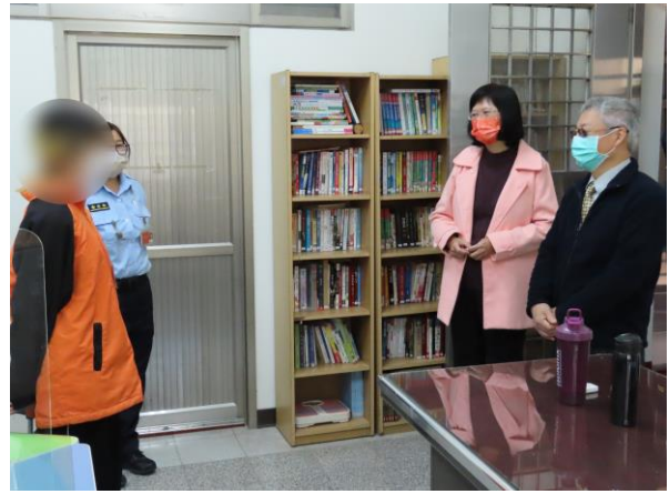
▲謝法官關懷少年狀況