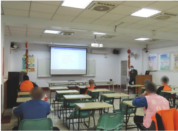
▲宋心理師講授情緒控管

1月9日、16日、30日14時至16時，由上善心理治療所宋心理師進行「科學實證之毒品犯處遇模式計畫」抗毒小團體諮商輔導課程，進行情緒及壓力辨識解析課程，加強少年自我約束及控管情緒之能力並提供適當方式參考，例如：繪畫、唱歌、運動…等，適時紓解壓力，計有少年32人次參加。