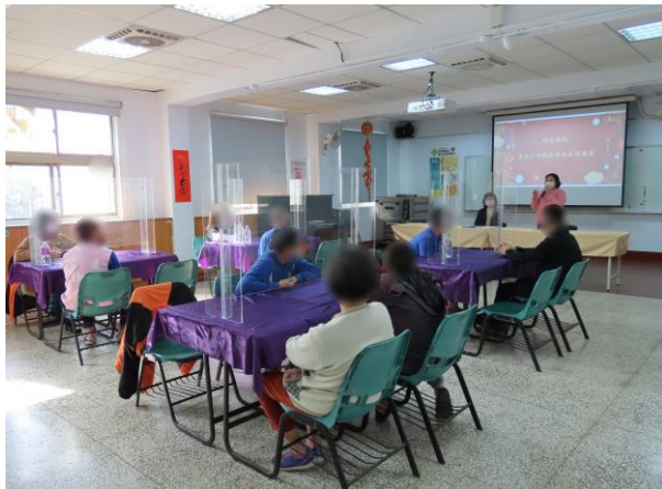
▲賴庭長期許少年改過自新

1月16日9時至11時，舉辦春節面對面懇親活動，邀請臺南地方法院少年法庭賴庭長蒞所勉勵少年，讓少年在春節過年前能與家長在所內見面。活動中由少年親手奉茶給家長，並向家長說出感謝與出所後的承諾，現場充滿溫馨感人的氣氛，計有少年5人、家長6人參加。