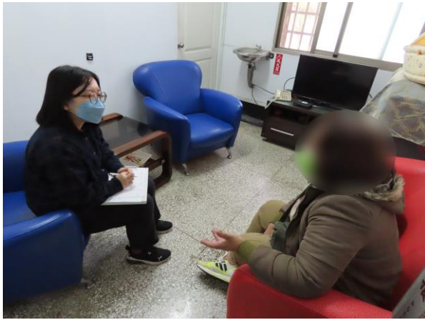
▲吳心理師與少年家長訪談

1月5日9時至11時，由本所吳心理師與在所少年之家長進行個別親職諮詢輔導，透過深入訪談其家庭狀況、協助家長與少年情感聯繫，進而修復及增進親子關係，計有家長1人參加。