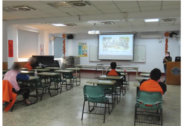
▲黃社工師勉勵少年改變自己