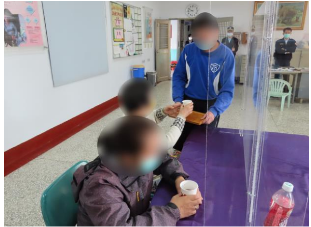
▲少年親手奉茶給予家長