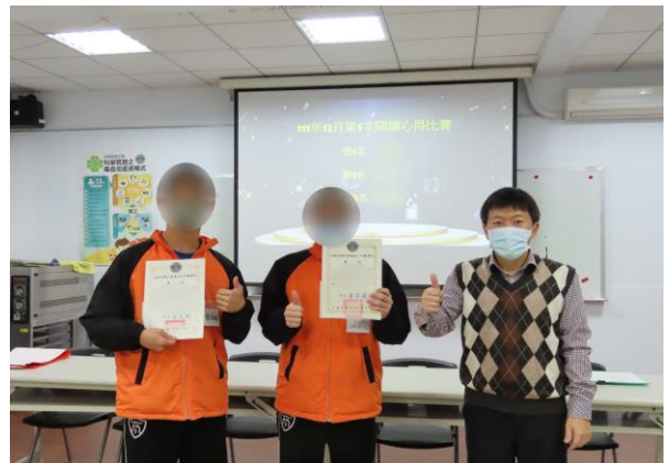
▲輔導科長頒發獎狀