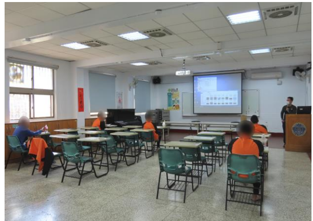
▲說明正確紓壓方式