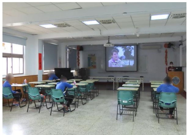
▲呼籲少年應把握時光