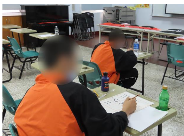
▲少年練習寫書法字