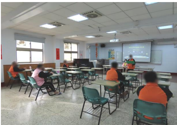
▲得獎少年閱讀心得分享

與社團法人臺南市觀護協會合作協助本所推動「閱讀悅好」活動，於每週進行閱讀書籍心得撰寫，錄取前三名少年可獲得該協會捐贈之參百元獎學金，並由所長公開表揚頒發獎狀，少年可透過閱讀增廣見聞、開拓視野，並且有益身心靈健康發展，本月計有少年20人次參加。