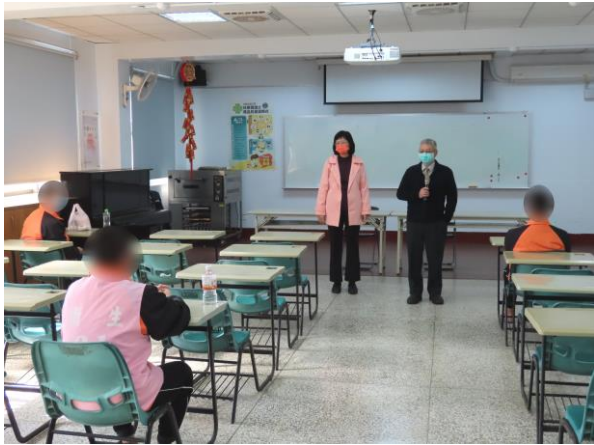
▲謝法官勉勵少年悔改向上

1月19日10時30分至11時，臺南地方法院少年法庭謝法官於春節前夕蒞所關懷在所少年，期許少年在新的一年能改悔向上、洗心革面，勿蹉跎光陰，要重新規劃未來並迎接嶄新的人生，計有少年8人參加。