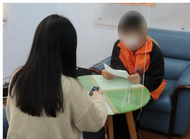
▲透過聲音傳達給家長