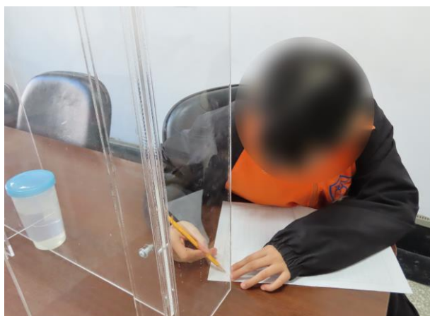
▲少年先書寫文字稿

1月10日14時至14時30分，進行枕邊細語紀錄活動，由少年書寫文字稿、寫下對家人的感謝與歉意，再由少年以錄音方式向家人表達，進而增進親子關係，計有少年1人參加。