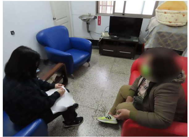
▲協助家長解決少年問題