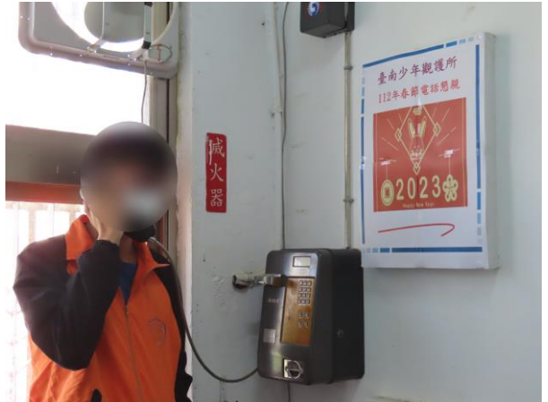
▲少年透過電話連繫家人