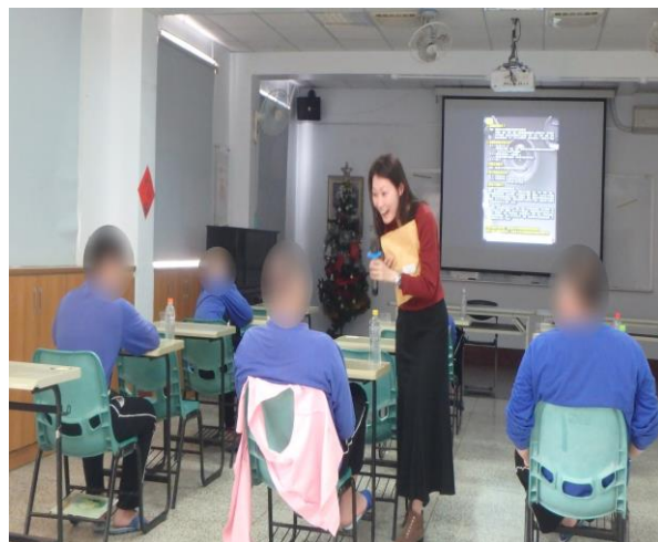
▲少年有獎徵答活動