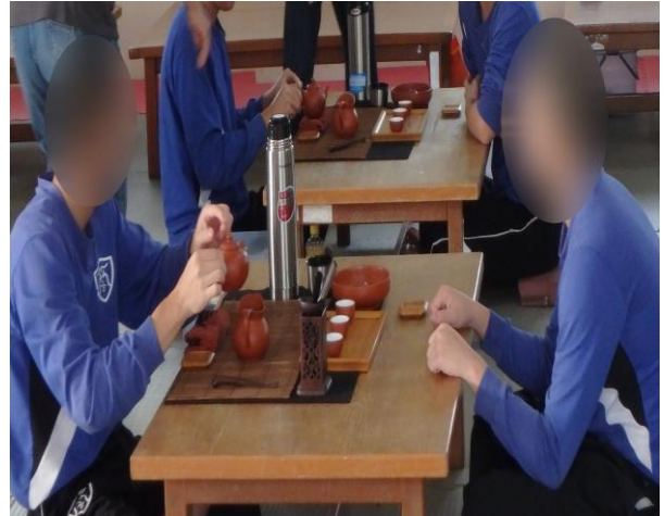
▲少年沏茶實際操作