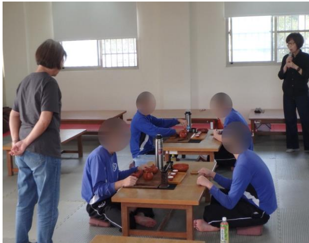
▲平老師基本茶道說明

12月3日、17日14時至15時，由平、李二位老師教導少年基本茶道操作說明，解說茶道禮儀即提升少年涵養氣質、興趣培養，計有少年39人次參加。