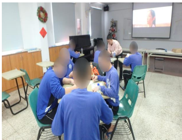
▲施理事長帶領少年製作卡片

12月29日9時至11時，由社團法人台南市全人教育及兒少發展協會施理事長與少年進行新年愛心卡片製作，計有少年17人次。