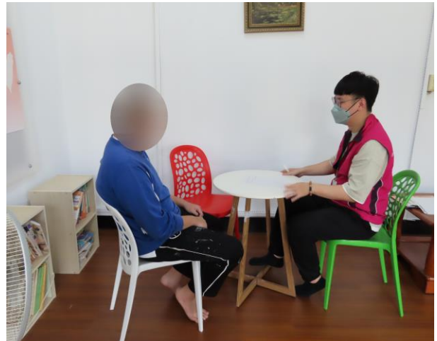
▲毒品少年銜接輔導