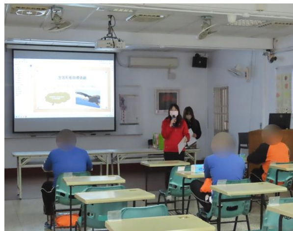
▲就業服務資源說明

1 月 28 日 14 時至 15 時，邀請永康就業服務中心林、陳就業輔導員及雲嘉南分署劉就業輔導員，進行求職服務宣導、生涯價值觀職業測驗等說明，計有少年 22 人次。