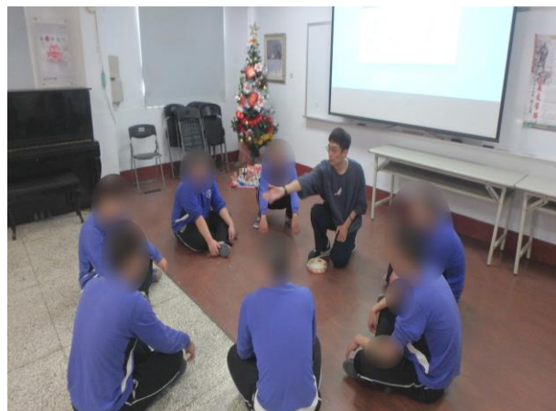
▲與少年進行音樂創作活動