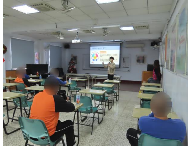
▲協助少年提供資源轉介