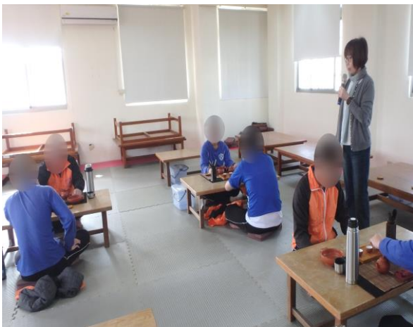
▲向少年說明茶道意涵

1月7日、21日15時至16時，由平、李二位老師教導少年基本茶道意涵與實際操作，解說茶道禮儀與提升少年涵養氣質、興趣培養，計有少年25人次參加。