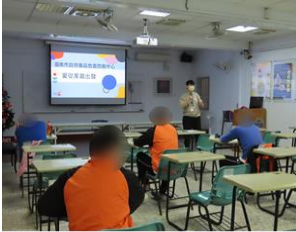
▲毒防中心介紹說明

1 月 9 日 15 時至 16 時，由臺南市政府毒品危害防制中心個管師進行反毒宣導、該中心資源服務介紹，計有少年 13 人次參加。