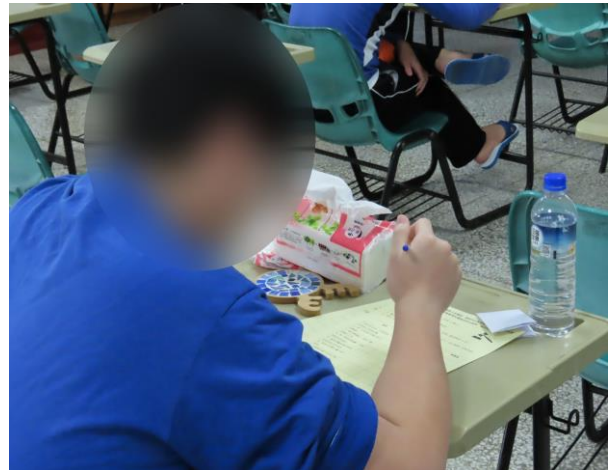
▲生涯價值觀職業測驗