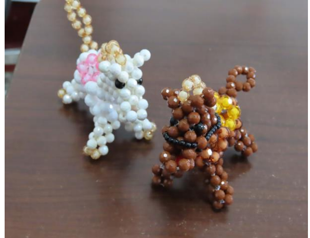
▲少年完成動物串珠作品