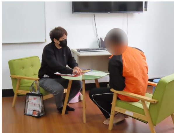
▲協助少年未來出所規劃