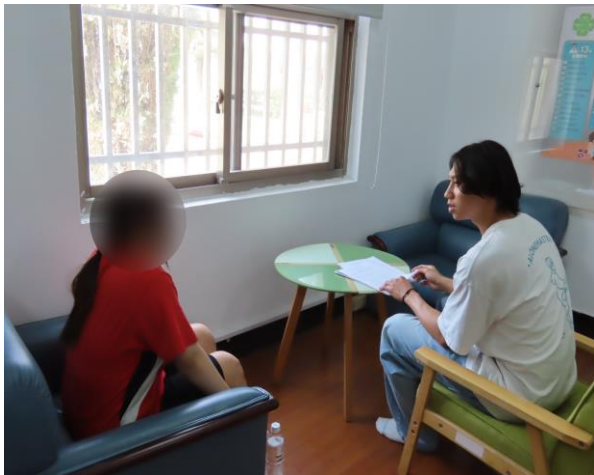
▲ 志工進行少年課業輔導

3月13日、20日14時至15時，由長榮大學志工學生們，協助在所之國中生少年課業銜接輔導，於未來返校時能繼續銜接課業及未來升學考試準備，計有少年6人次。