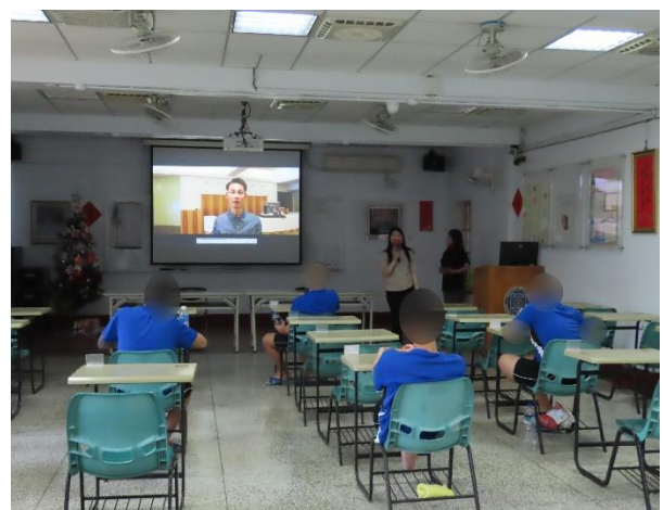
▲ 職業類別介紹說明