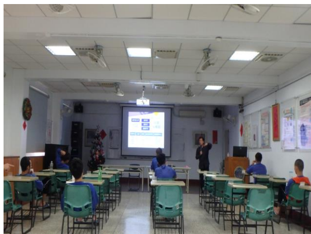
▲孫主任戒毒成功人士經驗分享

3月5日10時至11時，邀請晨曦會輔導所孫主任合作，進行戒毒成功人士經驗分享，勉勵少年能有改過自新、積極向上之精神；計有少年15人次。