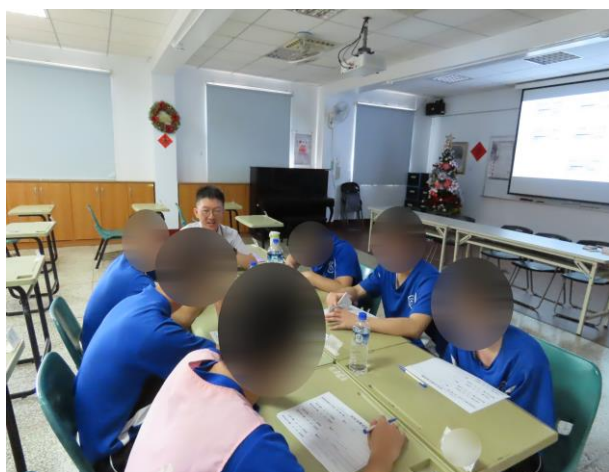
▲胡醫師說明毒品對身體之危害

3月26日15時至16時，邀請社團法人台南市全人教育及兒少發展協會施理事長與少年進行自我優勢能力、需求牌卡測驗說明，並與少年一起探索職業類別及未來規劃。