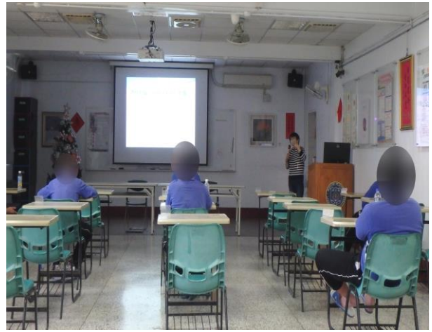
▲呼籲未成年請勿飲酒