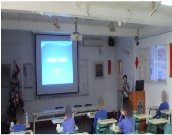
▲林社工師酒癮防制宣導

3月12日15時至16時，邀請台南市立醫院—林社工師合作辦理酒癮防制宣導，說明酒精對身體及心理健康危害，不當飲酒將造成健康受損、呼籲未成年請勿飲酒，計有少年13人次參加。