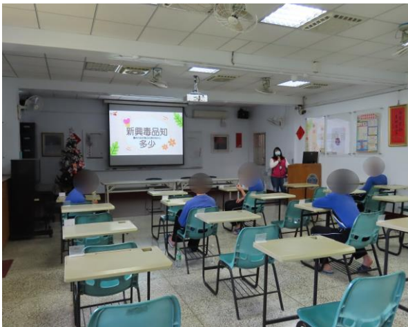
▲毒防中心反毒宣導

3月12日15時至16時，由臺南市政府毒品危害防制中心蕭個管師進行反毒宣導、該中心資源與家庭支持服務介紹，計有少年14人次參加。