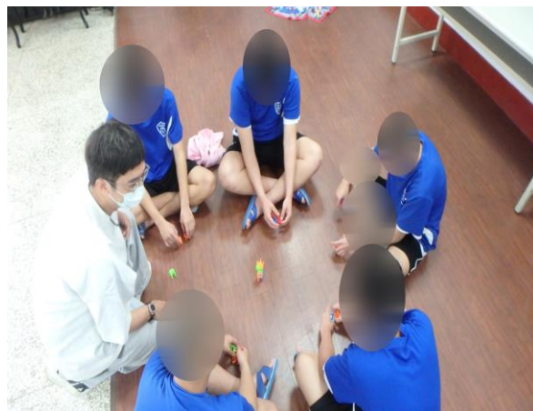
▲李老師與少年們互動課程