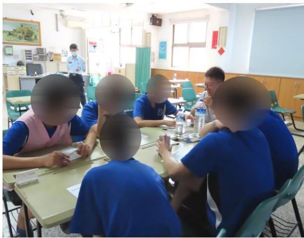
▲呼籲少年勿因好奇而使用毒品