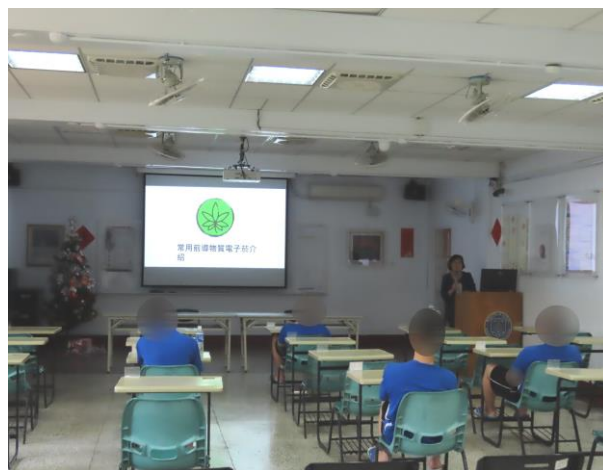
▲呼籲少年勿因好奇而使用毒品