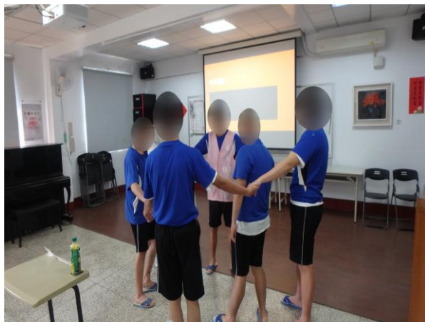
▲少年進行節拍律動課程

3月2日、16日9時至11時，由拓窗藝術教育團隊李老師進行青少年RAP創作、節拍律動、音樂文化介紹等互動課程，計有少年21人次。