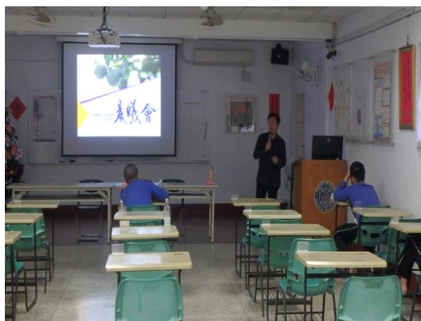
▲勉勵少年改過自新