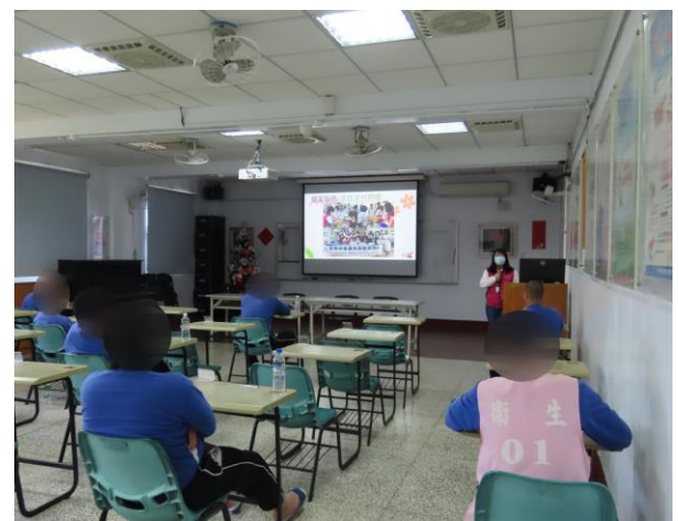
▲家庭支持服務說明