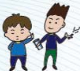
不接受陌生人的 飲料、香菸