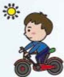
不靠藥物提神減肥 培養正常休閒活動