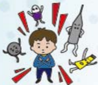
絕對不好奇 試用毒品