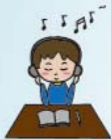
建立正確情緒 抒解方式